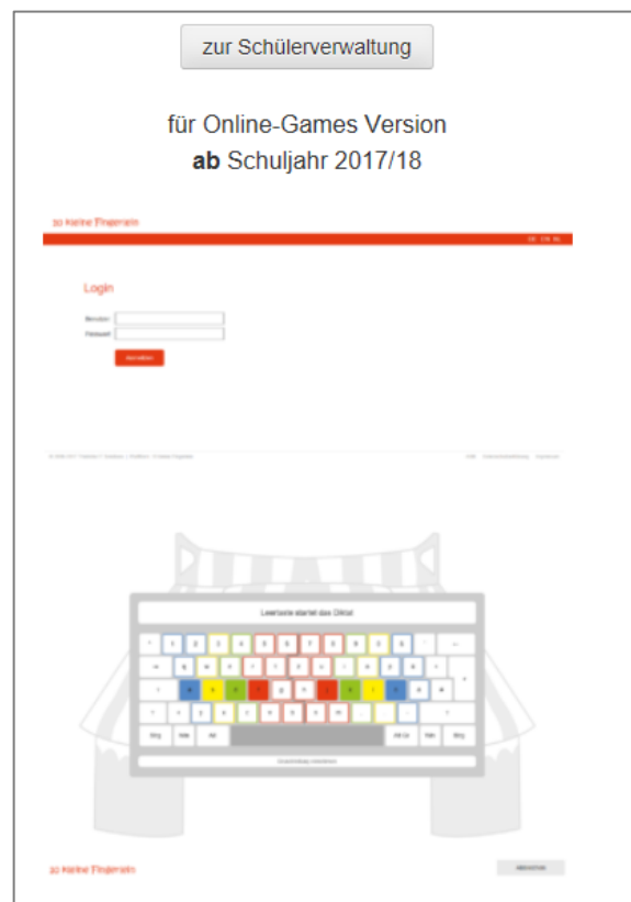
Abbildung 2: Zugang Lehrer

Auf der Login-Seite für die Schülerverwaltung geben Sie Ihren Benutzernamen und das Passwort ein, dass Sie von uns per Email im Zuge Ihrer Bestellung erhalten haben.