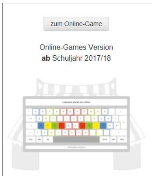
Abbildung 1: Zugang Schüler

Sowohl Schüler*innen, als auch Lehrkräfte werden mit einem Klick auf die jeweiligen Schaltflächen „ zum Online-Game “ und „ zur Schülerverwaltung “ auf die Login-Seite weitergeleitet.