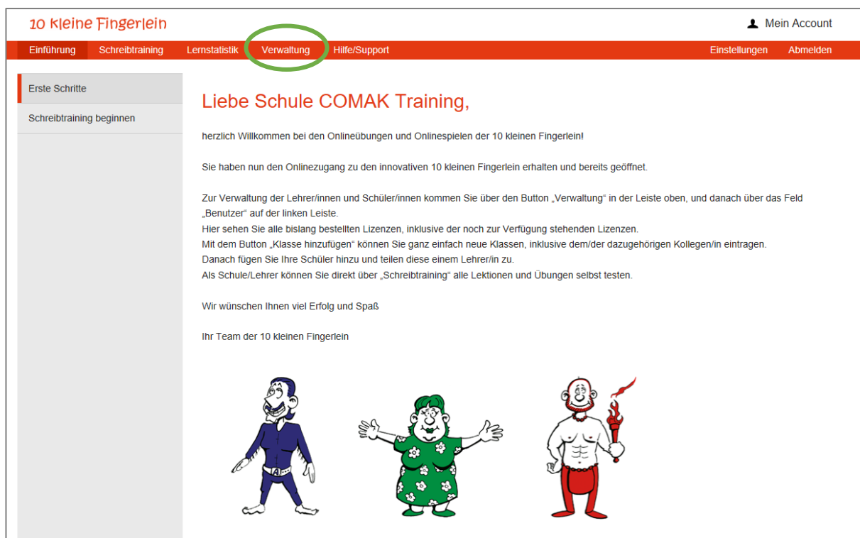
Abbildung 4: Willkommen-Seite

Um Ihre Schüler*innen anzulegen wählen Sie bitte den Menüpunkt „ Verwaltung “