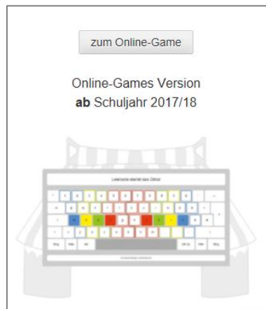
Abbildung 10: neue Version wählen