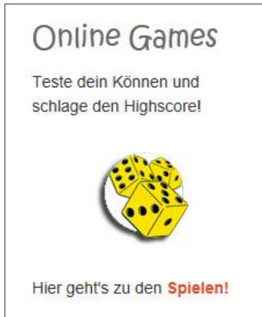
Abbildung 11: Online-Games wählen

Nachdem Sie Ihren Schüler*innen die Zugangsdaten (Benutzername und Passwort) weitergeleitet haben, können diese sich unter www.10kleinefingerlein.com und dem Menüpunkt „Online-Games“ anmelden.